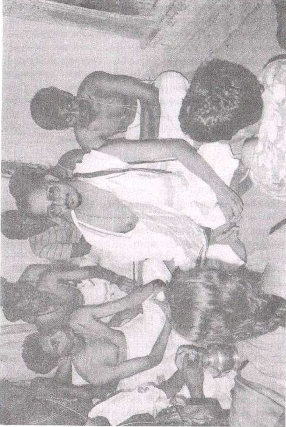
பூர் பிருந்தாவனத்தில், பக்தர்களுடன் பூர் ஸ்வாமிகள்