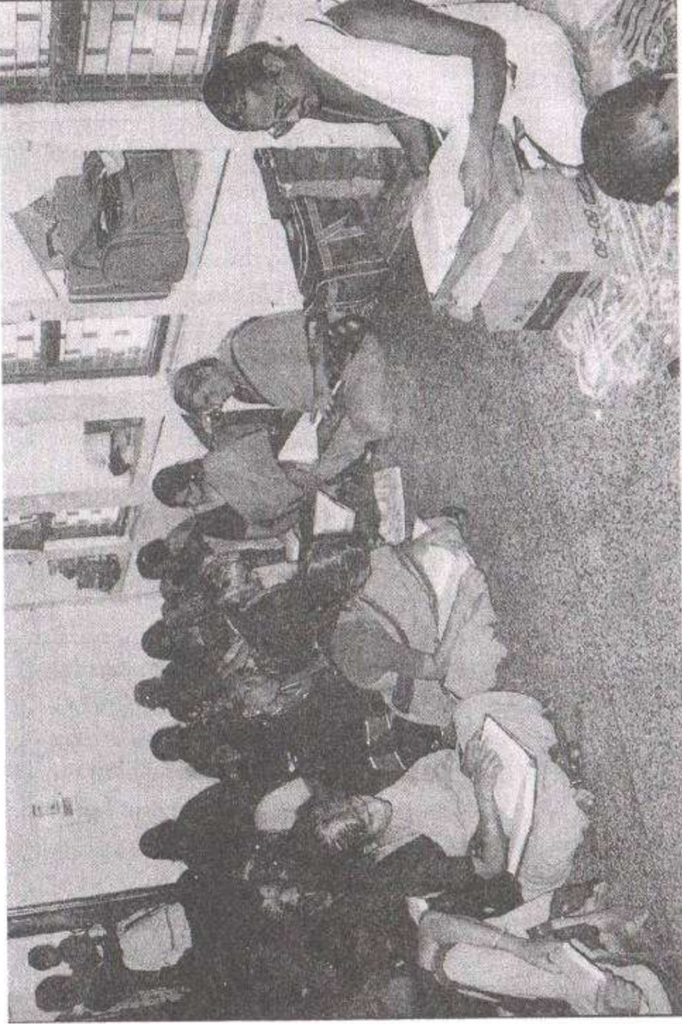
ஸ்ரீ ப்ருந்தாவனத்தில் ஸ்ரீ ஸ்வாமிகள்